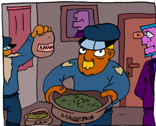
БИЛКО, ХВАНАТ В КРАЧКА